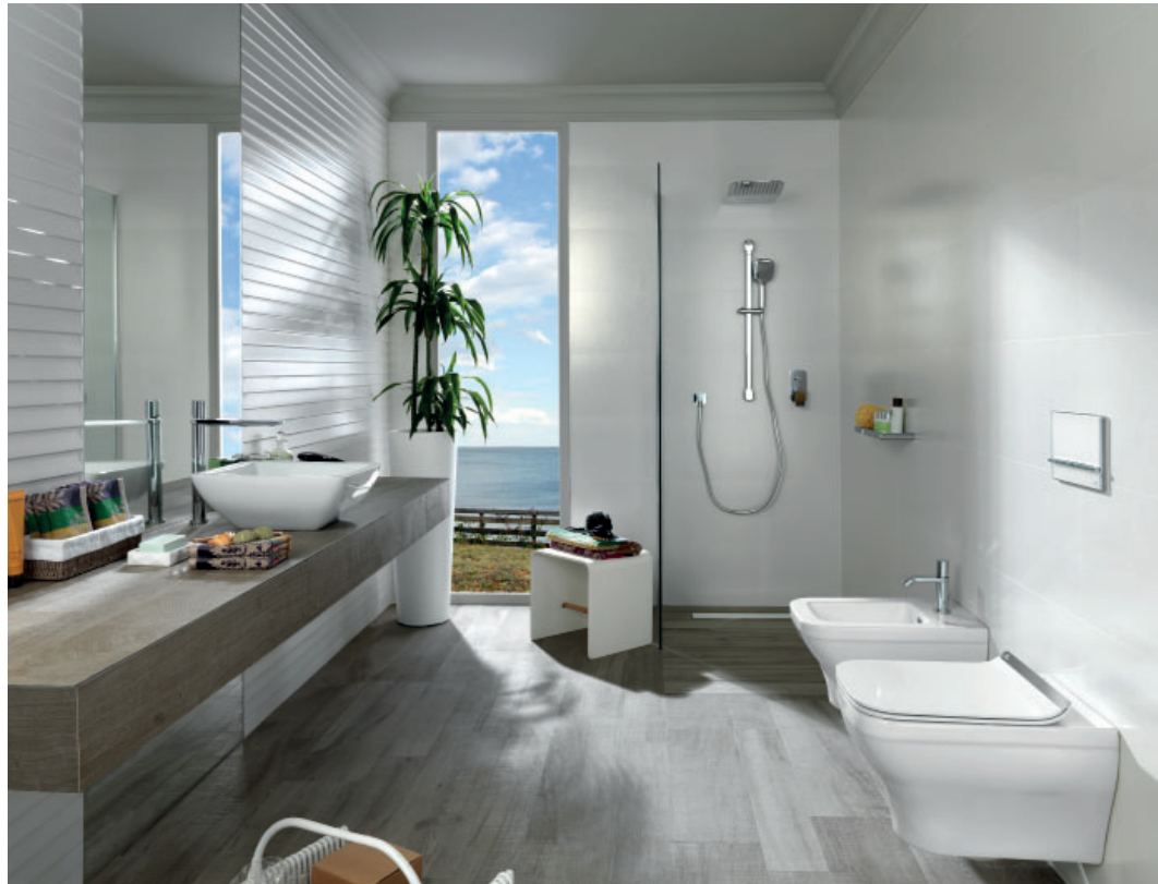
colección FORMA collection FORMA

Diverse global developers and world class hotels have already worked with Porcelanosa Bathrooms in relation to the compliance of these certificates, both in efficiency and savings and the added-value for its accommodations.